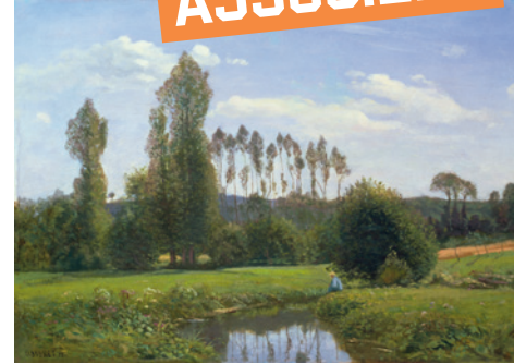
Claude Monet, Vue prise à Rouelles , 1858

Huile sur toile, 46 x 65 cm, Japon, Saitama, Museum of Modern Art, dépôt du Marunuma Art Park, Asaka